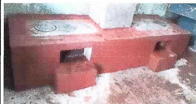
Foto 4: Sustitución de estufa rural (completa) incluye chimenea y plancha de metal