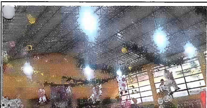
Foto 5: Instalacion de luz ( Interruptor y ducto cableado, tomacorriente y plafonera