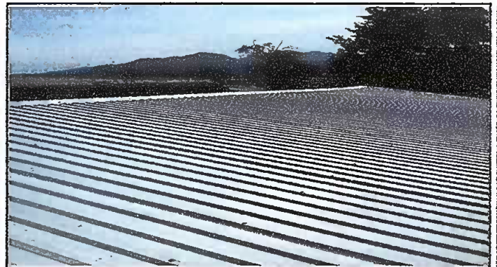
Foto 4: Sustitución de lámina, por lámina troquelada Aluzinc calibre 26 y sustitución de capote de lámina para lámina troquelada.