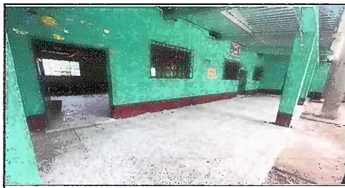
Foto 5: Sustitución de piso liso por piso de granito, aula 1 y corredor.