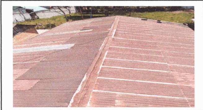
Foto1: Sustitución de lámina por lámina troquelada