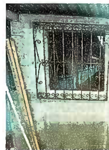
Foto. 6 Sustitución de balcon

Observación: Si es necesario se pueden agregar hojas adicionales y actualizar el número de hojas.