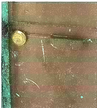
Foto1: sustitucion de chapas,