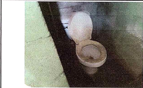
Foto1: Sustitucion de inodoro