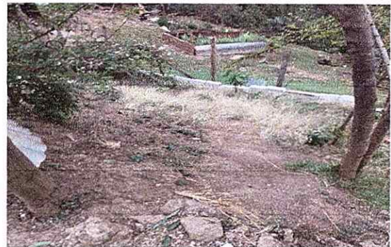
Foto 4: Reparacion de muro perimetral de blok con tubo AG y malla galvanizada