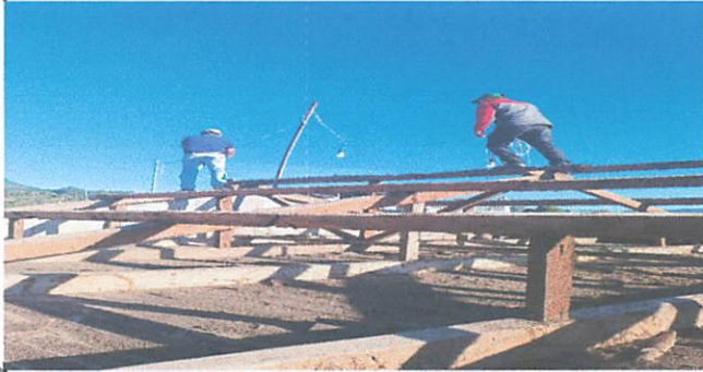
Foto1: CAMBIO DE reglas