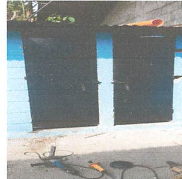
Foto 4: Sustitución de puertas de baños de madera por puerta de metal.