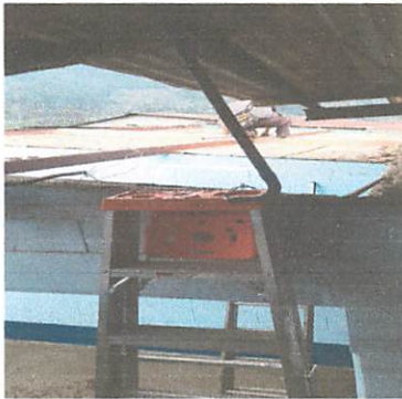
Foto 3: Sustitución de techo por lamina troquelada alucin de 26 pies.