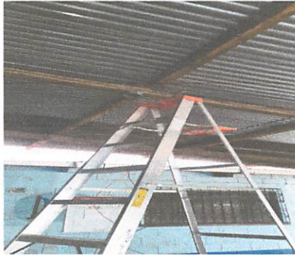
Foto1: Cambio de la red de la energia electrica.