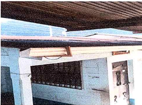
Foto 3: Sustitucion de estructura de soporte de madera por estructura de metal.