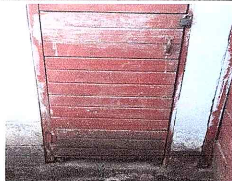
Foto 4: Sustituir puertas de los baños de madera por puertas de metal.