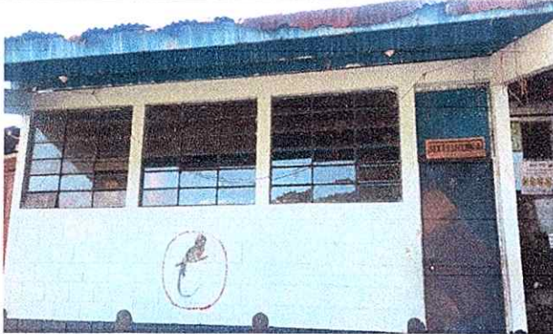
Foto1: Colocación de Balcones.