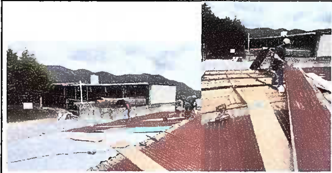
FOTO 1: Módulo 1, sustitucion de lámina por lámina troquelada y capote para lámina troquelada.