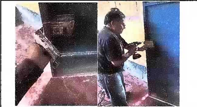
FOTO 3: Módulo 2, sustitucion de chapas y mantenimiento de puertas