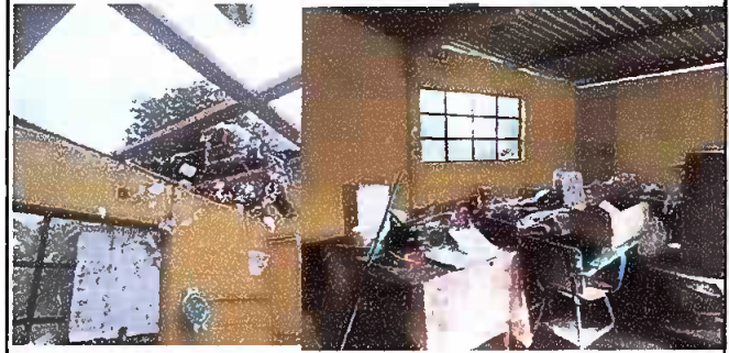
FOTO 2: Módulo 1, sustitucion de estructura de soporte de madera por metal