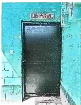
Foto 3: Vista de puerta de entrada sanitario de hombres arreglado