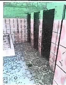
Foto 6: Puerta de módulos internos de sanitario de niñas arregladas

Observación: Si es necesario se pueden agregar hojas adicionales y actualizar el número de hojas.