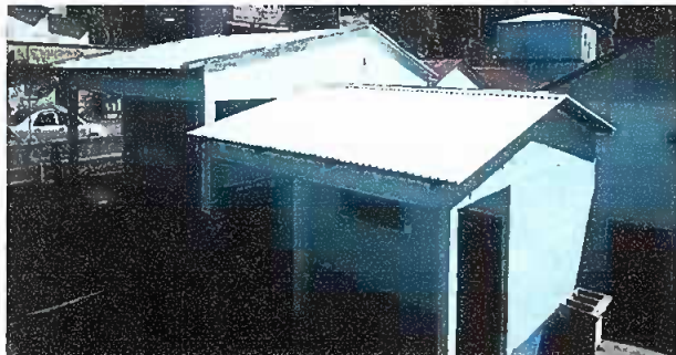
Foto 1: Sustitucion de láminas y sustitucion de estructuras de soporte de madera por metal