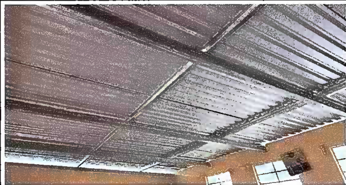
Foto1: ESTRUCTURA DE METAL PRIMER MODULO