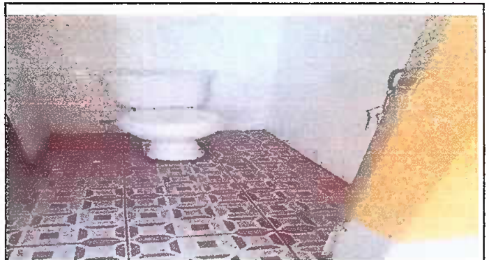
Foto 2: SUSTITUCION DE PISO DE TORTA DE CONCRETO POR PISO CERAMICO