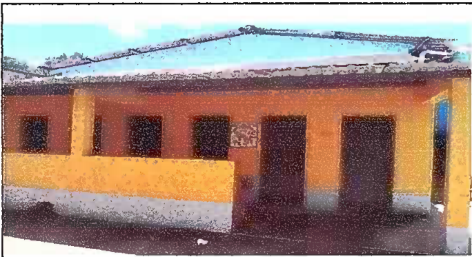
Foto1: SUSTITUCIÓN DE LÁMINAS, POR LÁMINAS TROQUELADAS