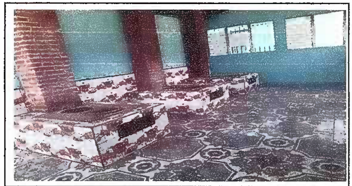
Foto 6: SUSTITUCIÓN DE PISO DE TORTA DE CONCRETO POR PISO CERAMICO Y SUSTITUCION DE CHIMINEA DE CONCRETO DE LADRILLO

Observación: Si es necesario se pueden agregar hojas adicionales y actualizar el número de hojas.