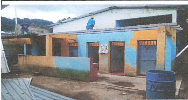
Foto1: SUSTITUCIÓN DE LÁMINAS, POR LÁMINAS TROQUELADAS