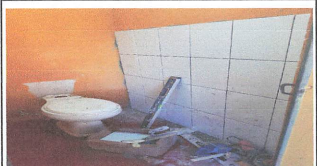
Foto 2: SUSTITUCION DE PISO DE TORTA DE CONCRETO POR PISO CERAMICO