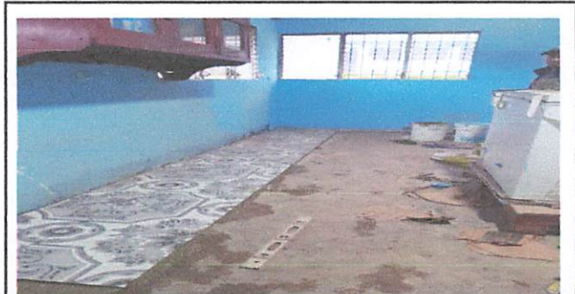
Foto 6: SUSTITUCIÓN DE PISO DE TORTA DE CONCRETO POR PISO CERAMICO Y SUSTITUCION DE CHIMINEA DE CONCRETO DE LADRILLO

Observación: Si es necesario se pueden agregar hojas adicionales y actualizar el número de hojas.