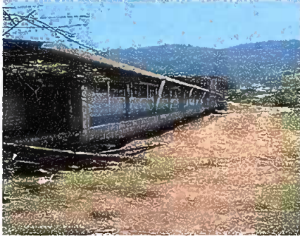
Foto1: Reparación de muro perimetral de block con tubo hg y malla galvanizada, soleras intermedias y columnas