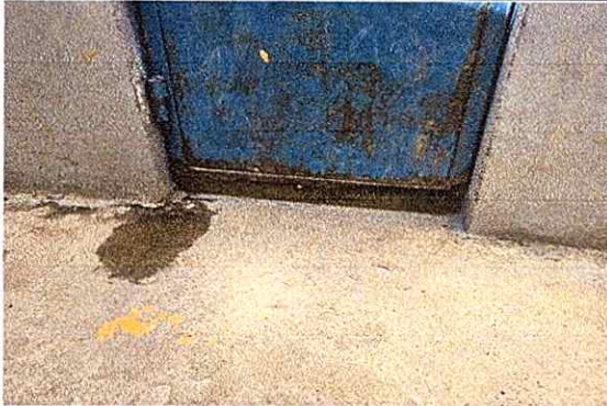
Foto1: Mantenimiento a puertas