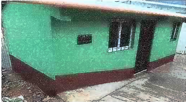
Foto1: Ampliación de la cocina