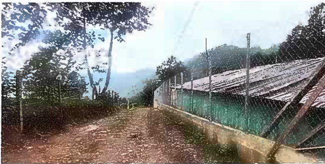
Foto 3: reparación de muro perimetral de block con tibo hg y malla y galvanizado soleras intermedias y columnas.