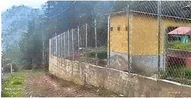
Foto 1: reparación de muro perimetral de block con tibo hg y malla y galvanizado soleras intermedias y columnas.