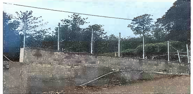
Foto 2: reparación de muro perimetral de block con tibo hg y malla y galvanizado soleras intermedias y columnas.