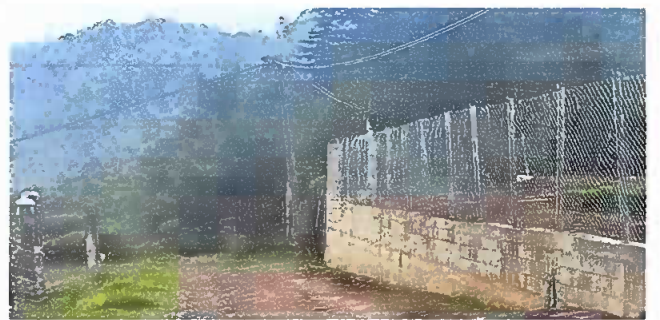
Foto 6: reparación de muro perimetral de block con tibo hg y malla y galvanizado soleras intermedias y columnas.

Observación: Si es necesario se pueden agregar hojas adicionales y actualizar el número de hojas.