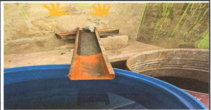
MODULO 2: FOTO 4. SUSTITUCIÓN DE CHORROS PARA BAÑOS