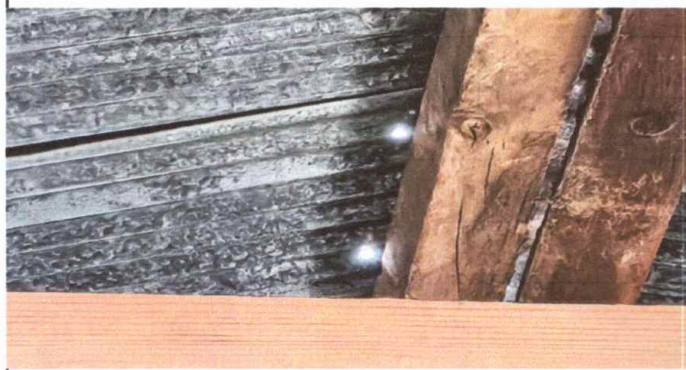
MODULO 1: FOTO 1. SUSTITUCIÓN DE PARTENTE DE MADERA A METAL DE SALON