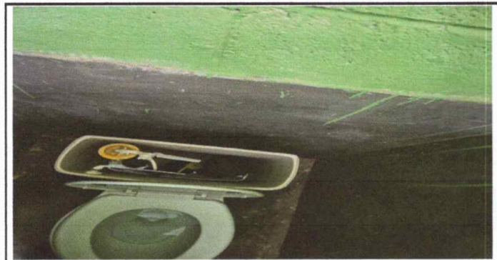
MODULO 2: FOTO 5. SUSTITUCIÓN DE ACCESORIOS DE INODOROS