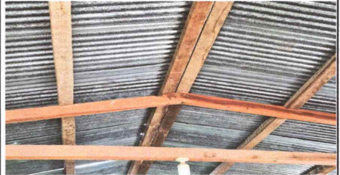
MODULO 1: FOTO 2. SUSTITUCIÓN DE LAMINA DE METAL POR LAMINA TROQUELADA