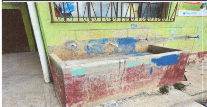
MODULO 2: FOTO 3. SUSTITUCIÓN DE CHORROS