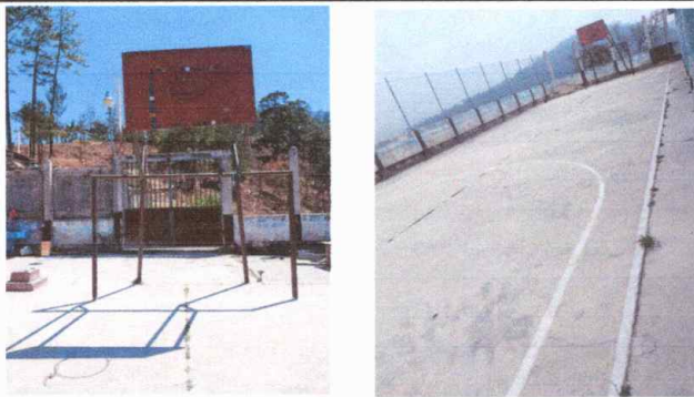
Cancha: mantenimiento de estructuras de metal de porterias y tablero; y aplicacion de pintura en cancha