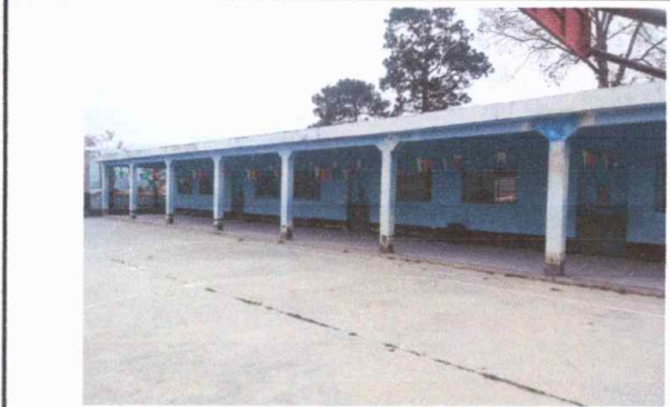
Modulo 1: pintura en paredes exteriores e interiores