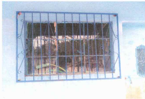
Módulo 1: sustitución de balcones de metal