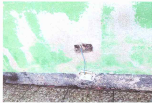
Modulo 1: sustitución de tomacorrientes, lamparas e interruptores