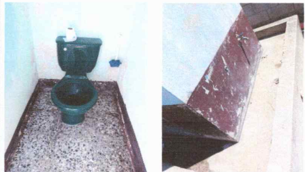
Módulo 1: sustitución de inodoros y lavamanos

Observación: Si es necesario se pueden agregar hojas adicionales y actualizar el número de hojas.