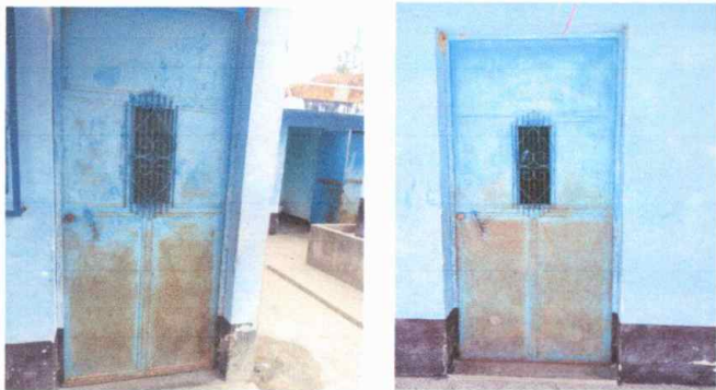
Modulo 1: mantenimiento a estructuras de puertas de metal