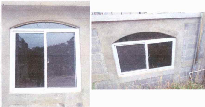
Modulo 2: fabricación e instalacion de balcones de hierro en ventanas