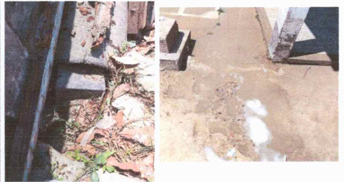
Patio: reparación de planchas de concreto