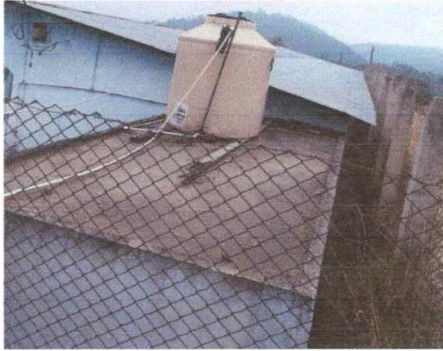
Módulo 1: sustitución de depósito de agua