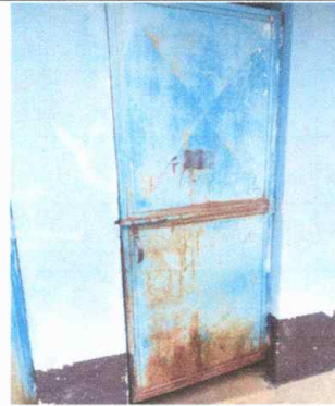
Modulo 1: sustitución de puertas de sanitarios