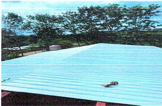
Foto 1: MODULO 1: Sustitución de lámina, por lámina troquelada aluzinc calibre 26