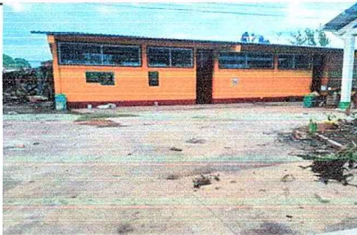
Foto 5: MODULO 1: Sustitución de ventanas de metal por Pvc mas vidrio