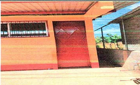
Foto 3: MODULO 1: Mantenimiento a estructura (aplicación de pintura) en puertas de metal