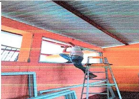
Foto 5: MODULO 1: Sustitución de ventanas de metal por Pvc mas vidrio