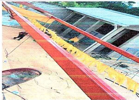
Foto 2: MODULO 1: Mantenimiento a estructura (aplicación de pintura) a costaneras en estructura de techado