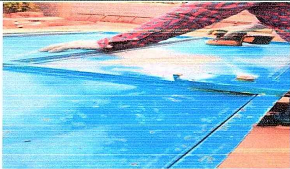
Foto 3: MODULO 1: Mantenimiento a estructura (aplicación de pintura) en puertas de metal