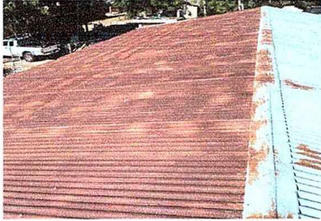
Foto1: MODULO 1:Sustitución de lámina, por lámina troquelada aluzinc calibre 26