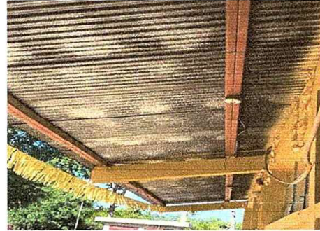
Foto 2: MODULO 1: Mantenimiento a estructura (aplicación de pintura) a costaneras en estructura de techado