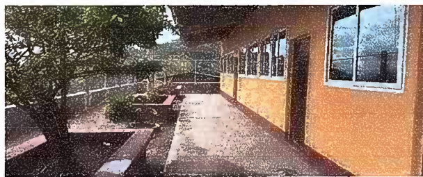
Foto 4: sustitucion de chapas. Nota: Se invirtion en pintura mas no en chapas.