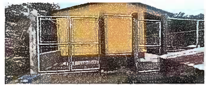
Foto 2: Reparacion de muro perimetral de block con tubo HG y maya Galbanizada, soleras intermedias y columnas