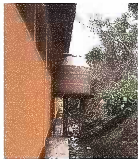
Foto 6: sustitucion de deposito de agua 1,000 LT. Reparacion de torta de piso de concreto

Observación: Si es necesario se pueden agregar hojas adicionales y actualizar el número de hojas.