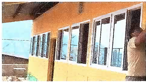
Foto1: Sustitucion de estructuta de metal de ventanas. y Sustitucion de vidrios