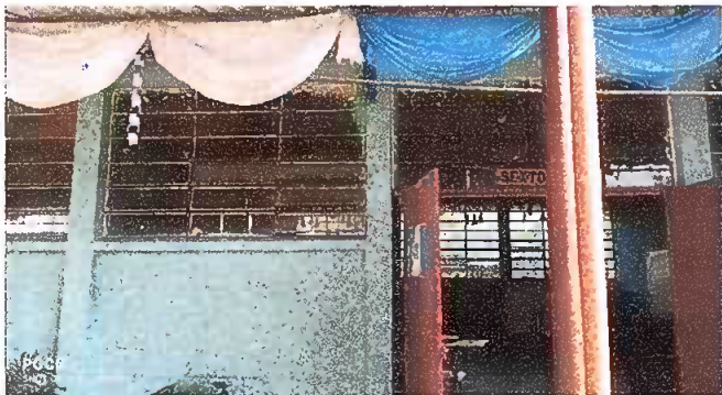
Foto 3: MODULO 2. sustitución de ventana de metal por PVC más vidrio.