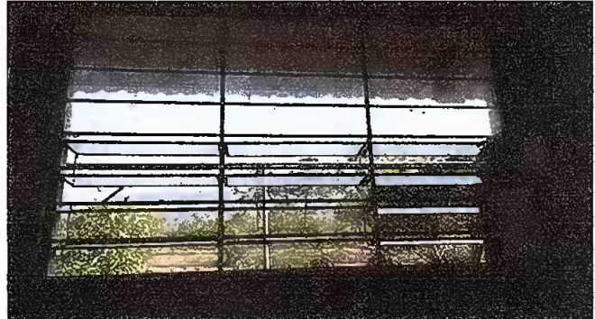
Foto 2: MODULO NO. 2 sustitución de ventana de metal por PVC más vidrio.