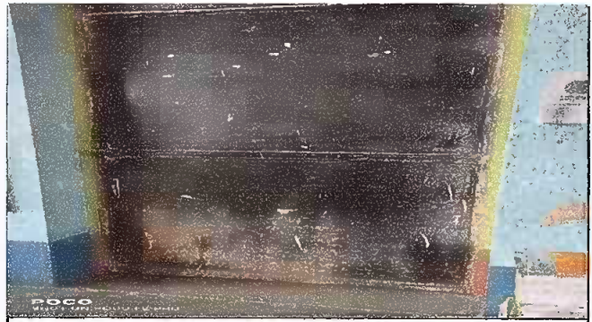
Foto 6: MODULO 2. mantenimiento a estructura (lijado, aplicación de pintura)

Observación: Si es necesario se pueden agregar hojas adicionales y actualizar el número de hojas.