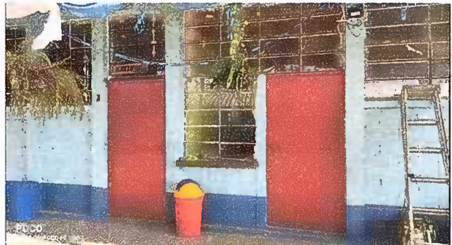
Foto 4: MODULO NO. 2 sustitución de ventana de metal por PVC más vidrio.