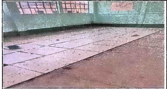
Foto 2: Proceso de colocación de piso cerámico tipo Porcelanato, en las aulas.