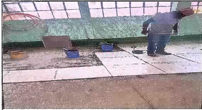
Foto 3: Proceso de colocación de piso cerámico tipo Porcelanato, en las aulas.