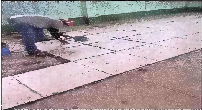
Foto 1: Proceso de colocación de piso cerámico tipo Porcelanato, en las aulas.