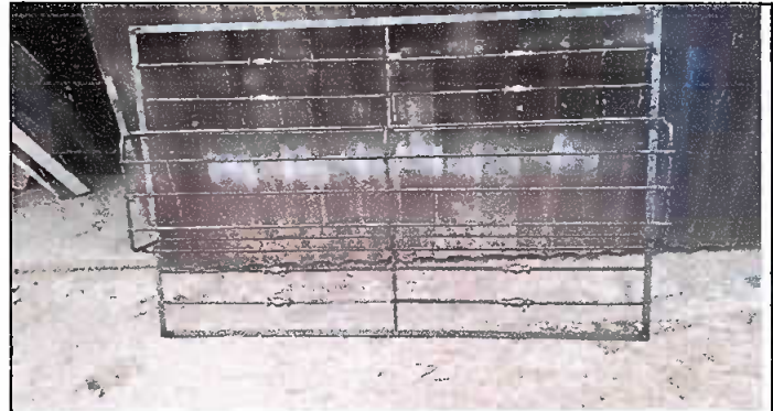
Foto 4: Fabricación de los balcones para la protección de las ventanas del establecimiento.