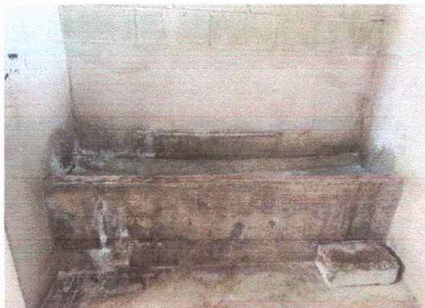
Foto1: Modulo 1 , Sustitucion de migitorio, sustitucion