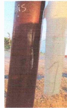
Foto Modulo 1 Sustitución de canal de pvc, sustitucion de soporte o pescante de metal para canal .