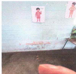
Foto 6: Modulo 1, Modulo 2, Modulo 3,4 y Modulo 5 Pintura en pared interiores

Observación: Si es necesario se pueden agregar Hojas adicionales, actualizar el número de hojas.