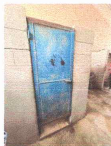
Foto 4: Modulo 1 Mantenimiento de estructura a puertas servicios sanitarios