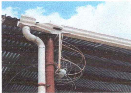
Foto Modulo 1 Sustitución de canal de pvc, sustitucion de soporte o pescante de metal para canal .