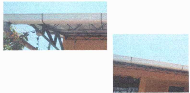
Foto Modulo 1 sustitucion de soporte o pescante de metal para canal .

Observación: Si es necesario se pueden agregar hojas adicionales y actualizar el número de hojas.