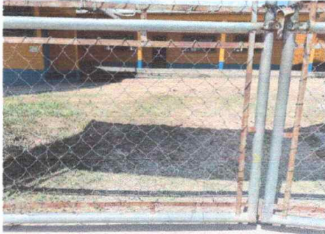
Foto1: Modulo 1 Sustitucion de Porton de Metal.