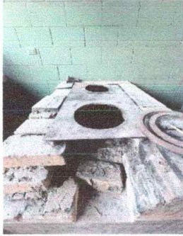
Foto1: Modulo 5, Sstitucion de Estufa Rural incluye chimenea y plancha de metal.