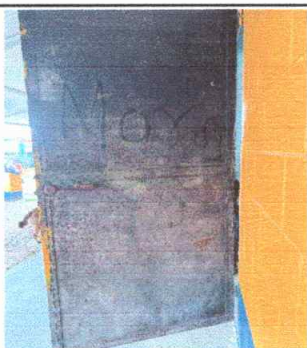
Foto 5: Modulo 1,2,3 mantenimiento de estructura de puertas lijado y pintura