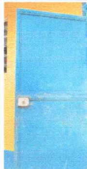
Foto 5: Modulo 4,5 mantenimiento de estructura de puertas lijado y pintura

Observación: Si es necesario se pueden agregar hojas adicionales y actualizar el número de hojas.