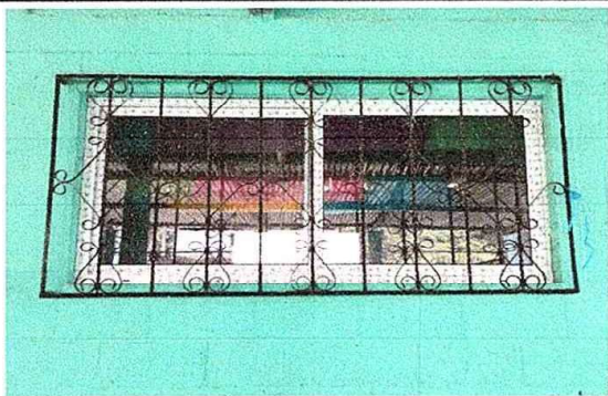
FOTO 3: MODULO 1: Sustitución de estructura de metal de ventanas.