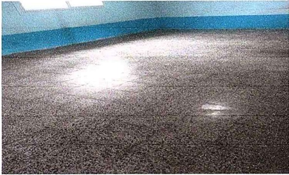
FOTO 1: MODULO 1: Sustitución de piso de torta de concreto por piso de granito.