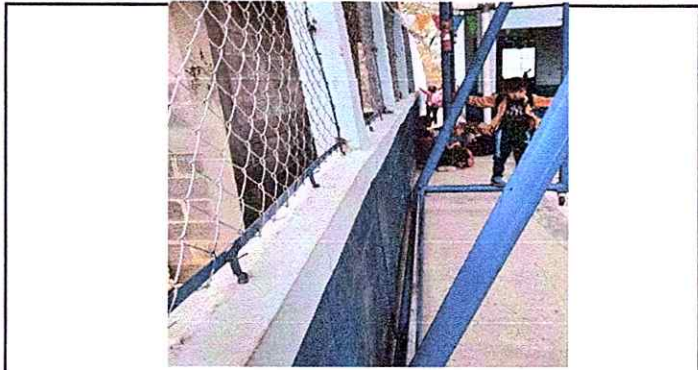
Foto1: Reparación de muro perimetral de block