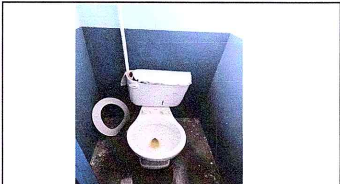
Foto 3: Sustitución de Inodoros y repación de piso y pintura en muros exteriores e interiores