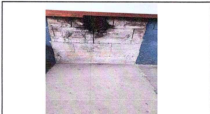
Foto 4: Sustitución de estufa Rural (completa) incluye plancha de metal y reparación de azulejos.