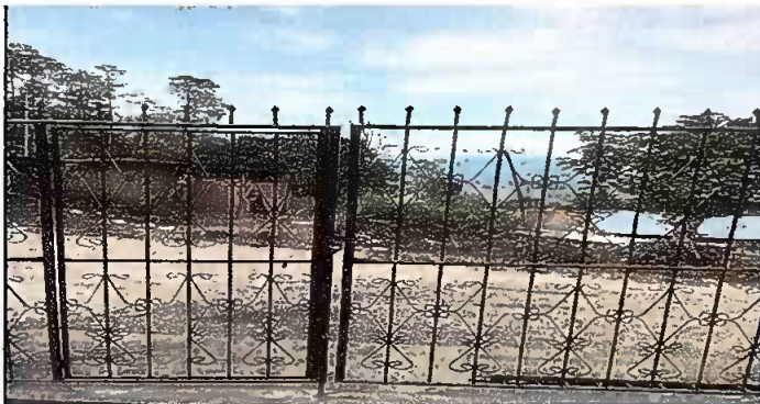
MÓDULO 3: MANTENIMIENTO A PORTÓN