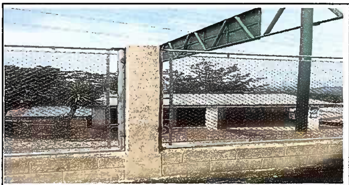
MÓDULO 3: REPARACIÓN DE TUBO HG Y MALLA GALVANIZADA

Observación: Si es necesario se pueden agregar hojas adicionales y actualizar el número de hojas.