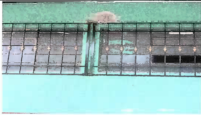
MÓDULO 2: SUMINISTRO DE BALCONES