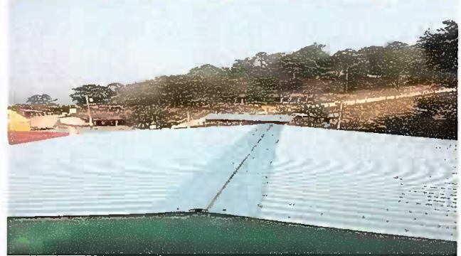
MÓDULO 2: TECHADO