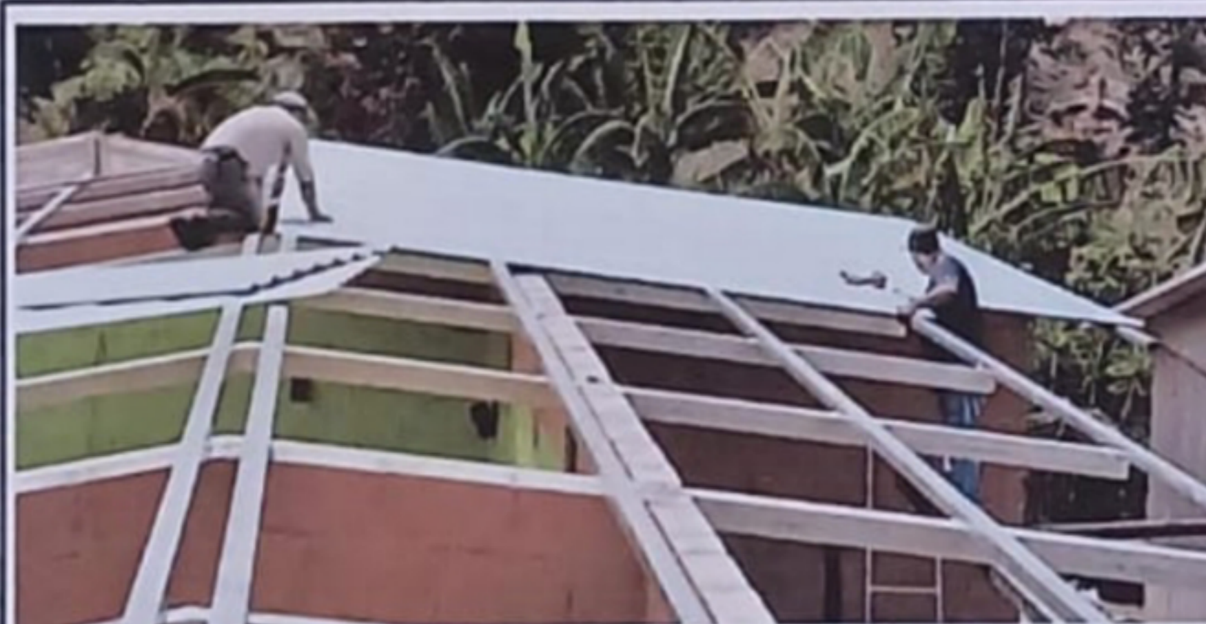
Módulo 2: Sustitución de lámina, por lámina troquelada aluzinc calibre 26