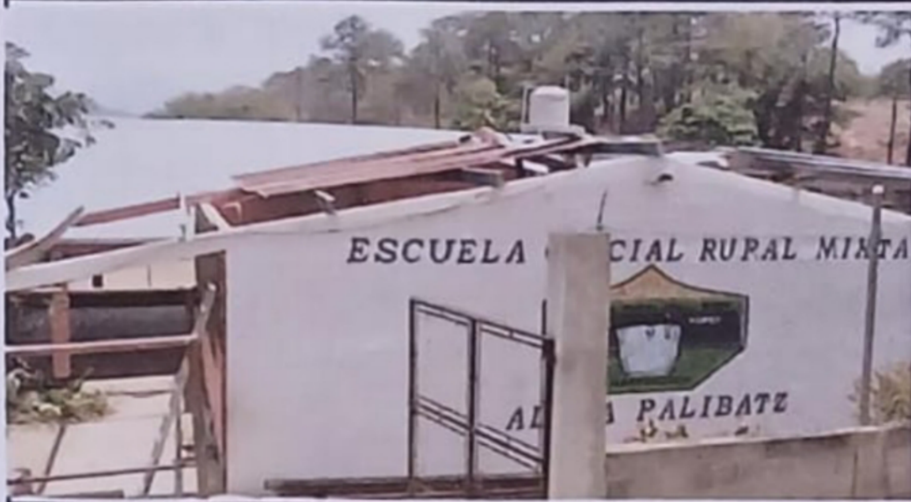
Módulo 1: Sustitución de estructura de soporte de metal por metal