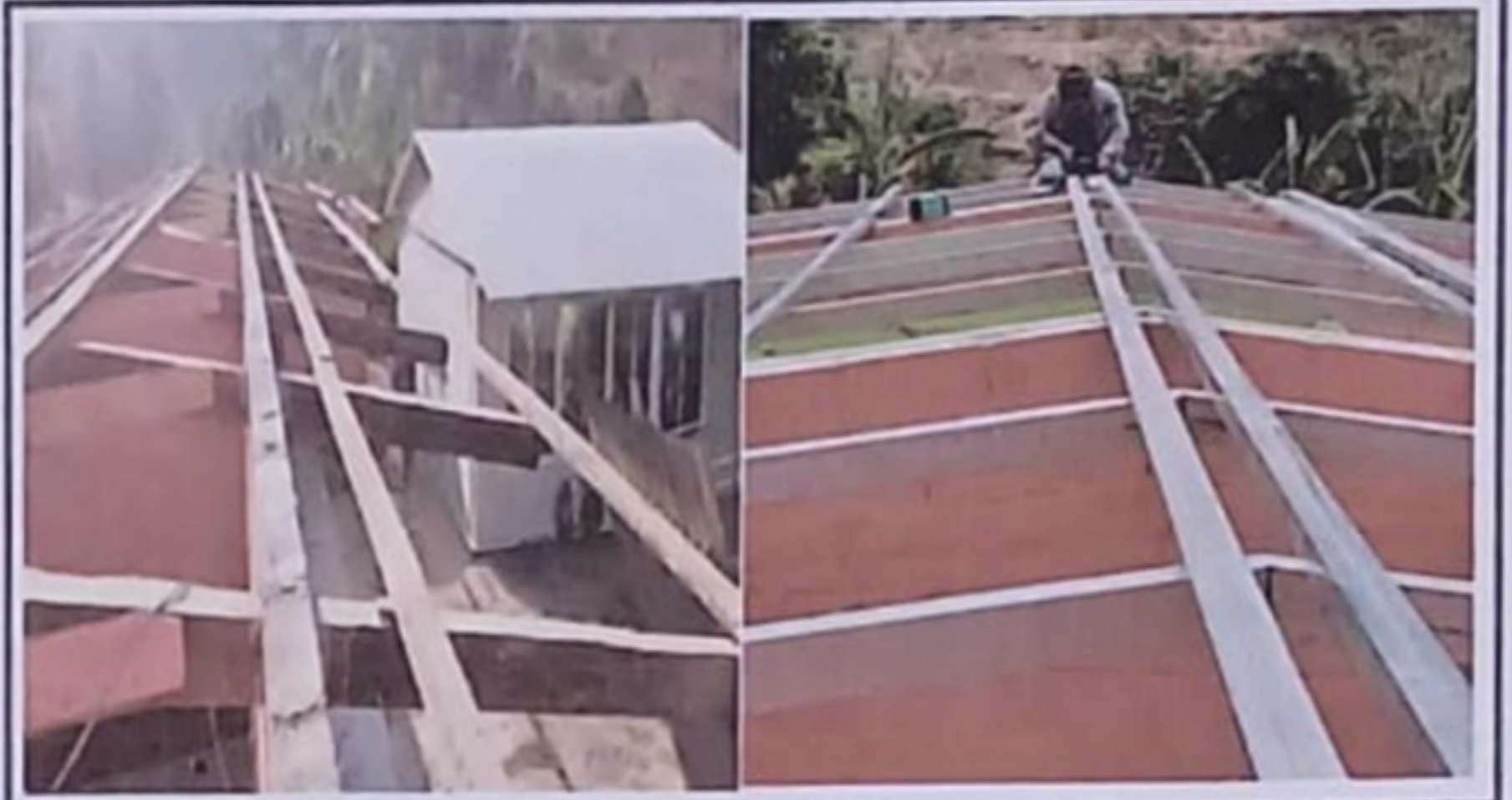
Módulo 2: Sustitución de estructura de soporte de madera por metal