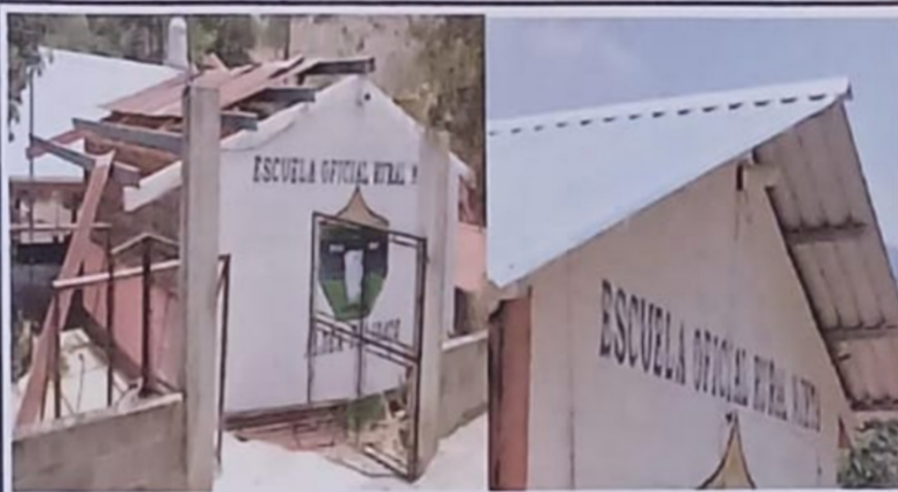
Módulo 1: Sustitución de lámina, por lámina troquelada aluzinc calibre 26