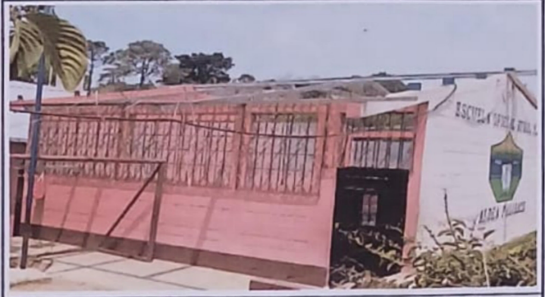
Módulo 1: Sustitución de estructura de soporte de metal por metal