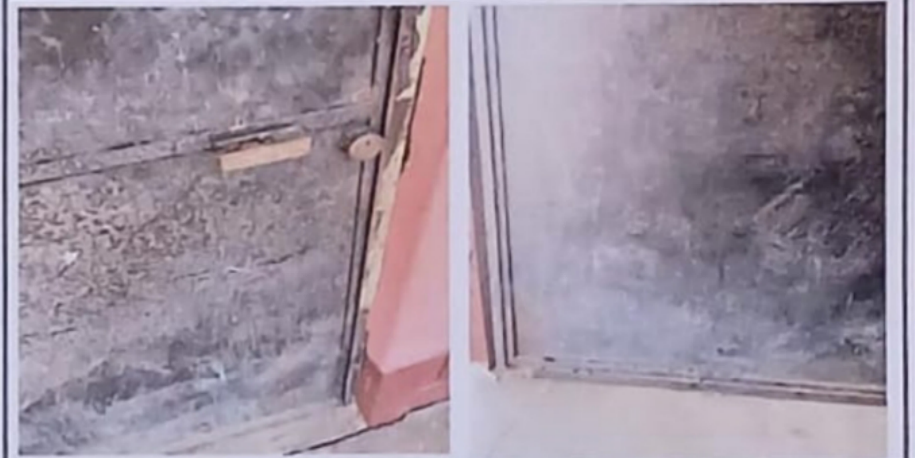
Módulo 2: Sustitución de puertas de metal

Observación: Si es necesario se pueden agregar hojas adicionales y actualizar el número de hojas.