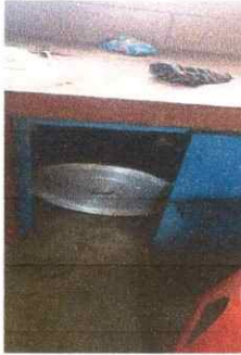
Foto1: Sustitución de puertas de metal de cocina.