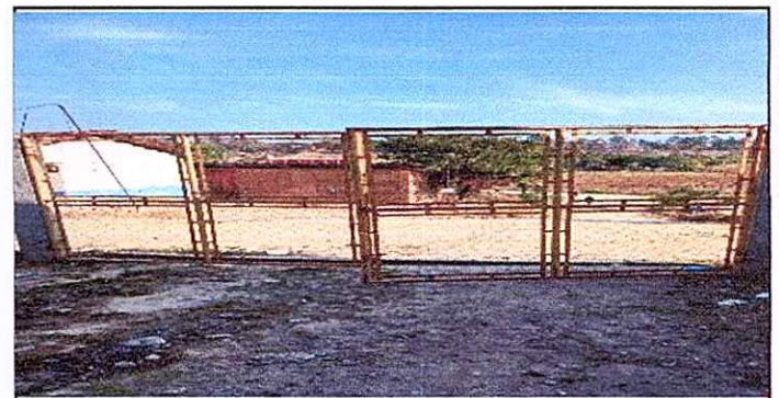
Foto 6: FABRICACIÓN E INSTALACIÓN DE PORTÓN DE METAL DE INGRESO. MEDIDAS 4.8 CENTIMETROS X 2.40 CENTIMETROS.

Observación: Si es necesario se pueden agregar hojas adicionales y actualizar el número de hojas.