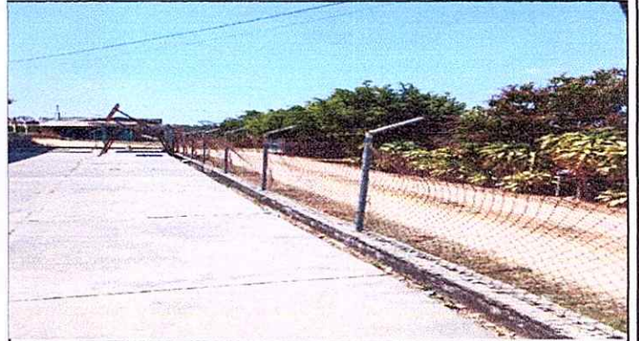
Foto 2: REPARACIÓN DE MURO PERIMETRAL DE BLOCK CON TUBO HG Y MALLA GALVANIZADA, SOLERAS INTERMEDIAS Y COLUMNAS