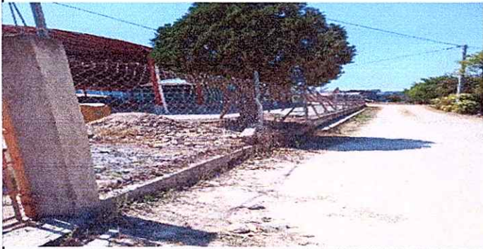
Foto1: REPARACIÓN DE MURO PERIMETRAL DE BLOCK CON TUBO HG Y MALLA GALVANIZADA, SOLERAS INTERMEDIAS Y COLUMNAS