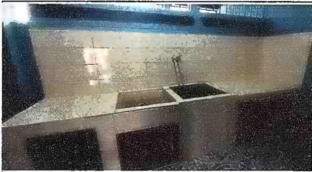
Modulo 1 Foto 1: Remodelacion de pila, en la cocina.