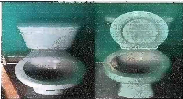
Modulo 2 Foto 5: Sustitución de accesorios inodoro (contra llave, tubo de abasto y tanque) Sustitución de tapadera sanitario