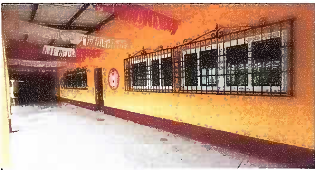
Modulo 3 Foto 6: Sustitución de estructura de metal, vidrio de ventana y balcones de metal

Observación: Si es necesario se pueden agregar hojas adicionales y actualizar el número de hojas.