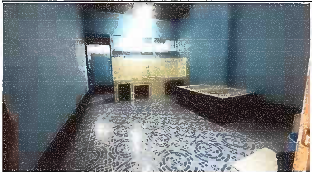
Modulo 1 Foto 4: Sustitución de piso cerámico