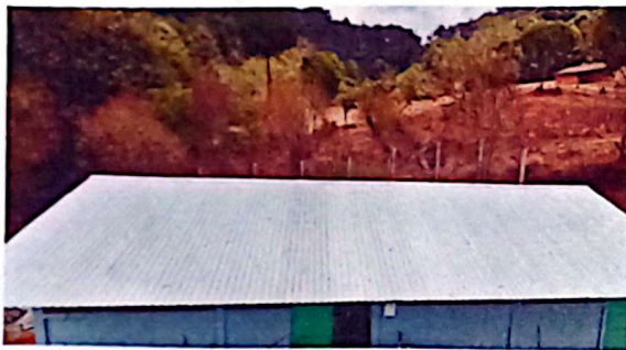
Modulo 1. Suministro e instalacion de canal de metal e instalacion de bajada de agua pluvial