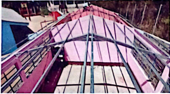
Modulo 1 Sustitución de lámina de duralita por lamina troquelada, sustitución de estructura de soporte de metal por metal y sustitución de capote