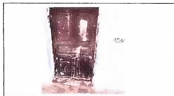
Foto 6: puertas sin llaves. dificultando el resguardo de los insumos.

Observación: Si es necesario se pueden agregar hojas adicionales y actualizar el número de hojas