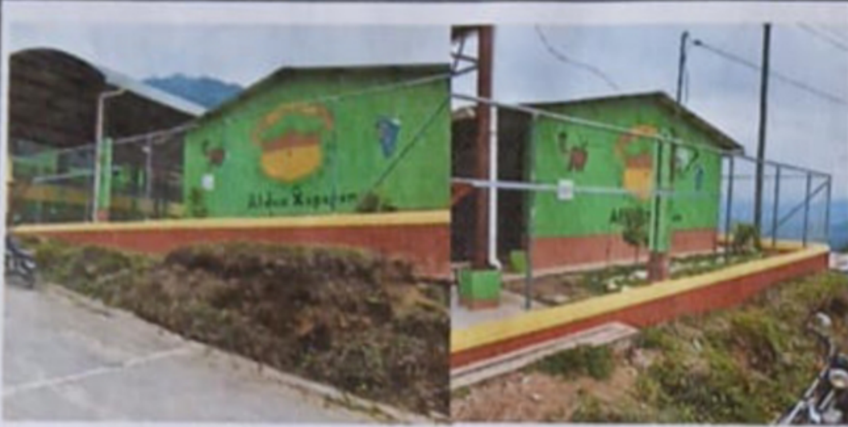
Foto1: sustitucion de malla