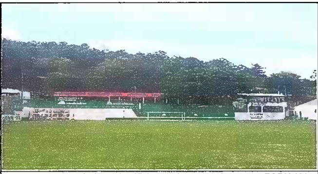
Foto 6: vista panorámica del edificio escolar con techo nuevo EORM Aldea Chuaquenum.

Observación: Si es necesario se pueden agregar hojas adicionales y actualizar el número de hojas.