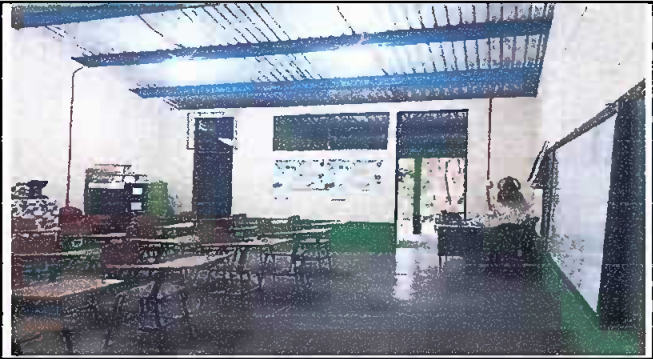
Foto 2: Sustitución de cableado del circuito electrico EORM Aldea Chuaquenum