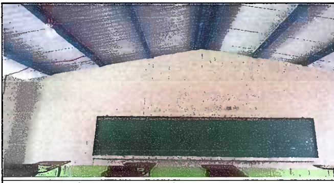
Foto 5: Sustitución del techo y mantenimiento a estructura de metal en EORM Aldea Chuaquenum.