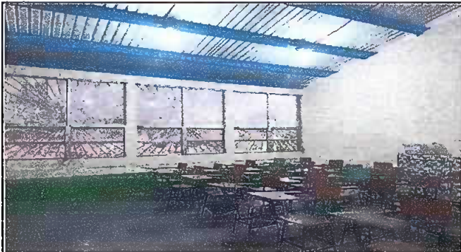
Foto 3: Aula del modulo #1 con techo nuevo e instalacion eléctrica EORM Aldea Chuaquenum