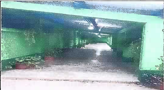
Foto 4: Sustitución de Láminas, Mantenimiento a estructura soporte de metal en todo el corredor del modulo #1 de la EORM Aldea Chuaquenum