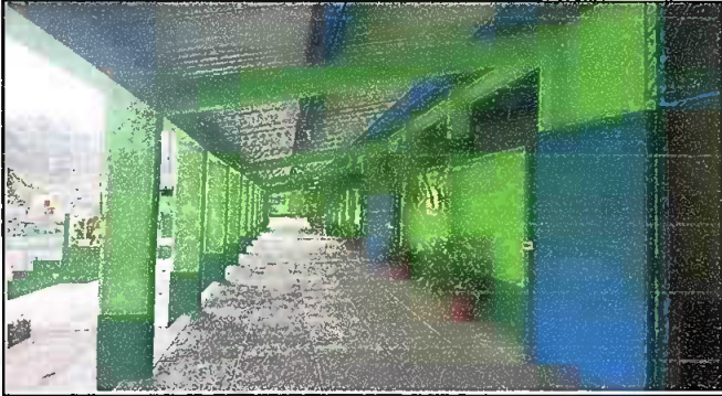
Foto1: Sustitución de Láminas, Mantenimiento a estructura soporte de metal