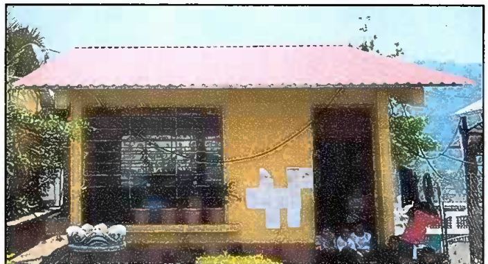
Modulo 2: Sustitucion de lamina, sustitucion de capote, sustitucion de estructura.