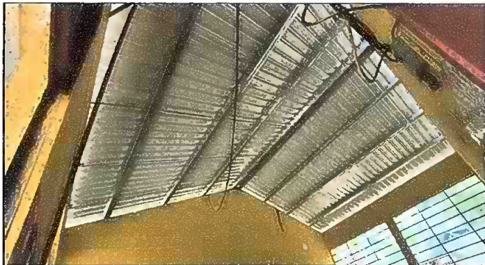
Modulo 2: Sustitucion de lamina, sustitucion de capote, sustitucion de estructura.