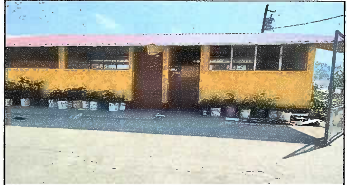
Modulo 1: Sustitucion de lamina, sustitucion de capote, sustitucion de estructura.