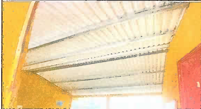
Modulo 1: Sustitucion de lamina, sustitucion de capote, sustitucion de estructura.