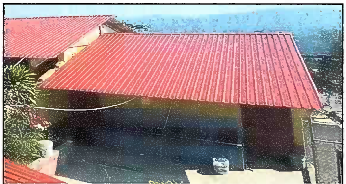
Modulo 3: Sustitucion de lamina, sustitucion de capote, sustitucion de estructura.

Observación: Si es necesario se pueden agregar fotos de los trabajos, actualizar el número de hojas.