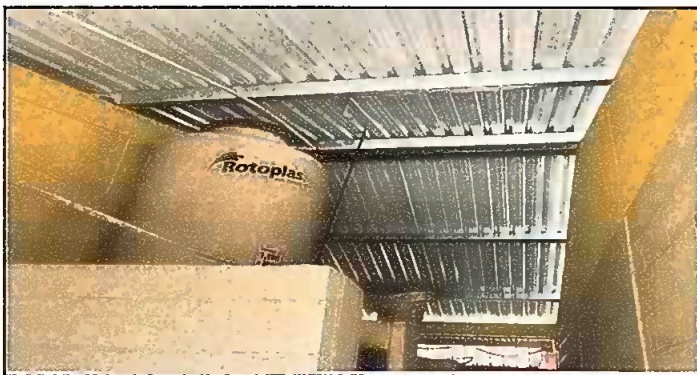
Modulo 3: Sustitucion de lamina, sustitucion de capote, sustitucion de estructura.