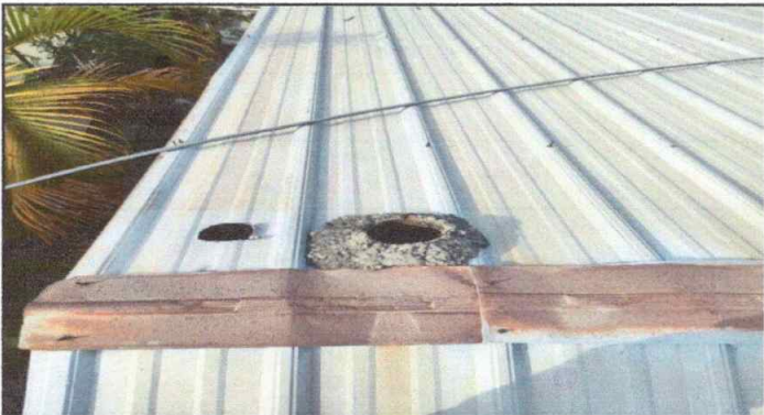
Modulo 2: Sustitucion de lamina, sustitucion de capote, sustitucion de estructura.