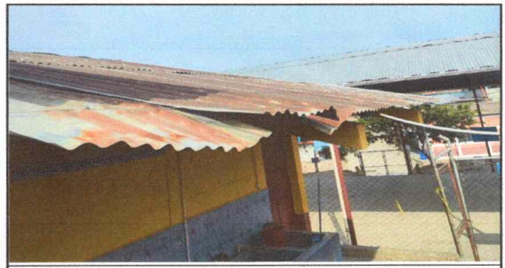
Modulo 3: Sustitucion de lamina, sustitucion de capote, sustitucion de estructura.

Observación: Si es necesario se pueden agregar hojas adicionales y actualizar el número de hojas.