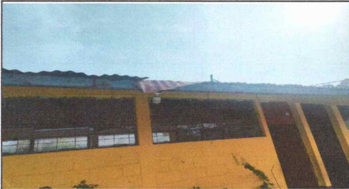
Modulo 1: Sustitucion de lamina, sustitucion de capote, sustitucion de estructura.