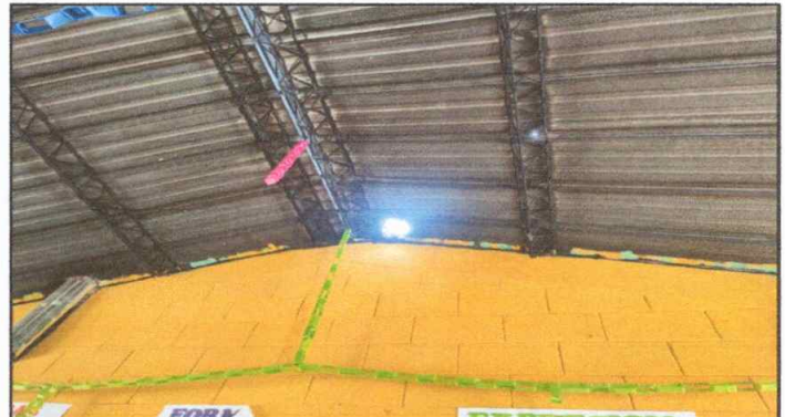
Modulo 2: Sustitucion de lamina, sustitucion de capote, sustitucion de estructura.