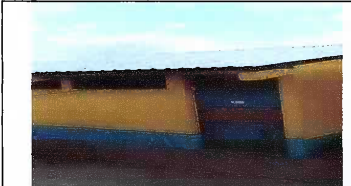
Foto 3: SUSTITUCION DE LAMINA, POR LAMINA TROQUELADA, CALIBRE 26. SUSTITUCION DE CAPOTE DE LAMINA, PARA LAMINA TROQUELADA.