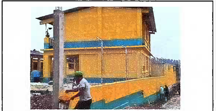
Foto 4: PINTURA EN MUROS EXTERIORES E INTERIORES, 8 AULAS, COCINA Y BAÑOS, INTERIOR Y EXTERIOR.