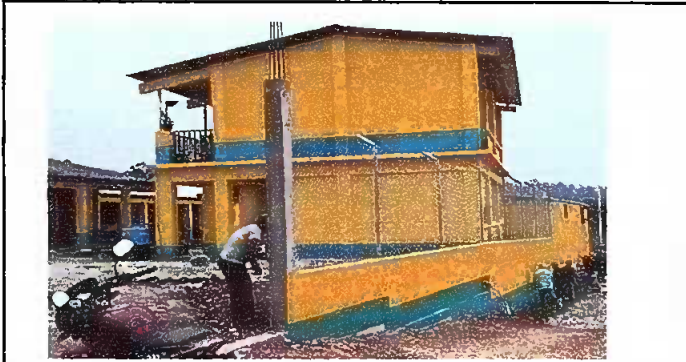
Foto1: REPARACION DE MURO PERIMENTAL DE BLOCK CON TUBO HG Y MALLA GALBANIZADA, SOLERAS INTERMEDIAS Y COLUMNAS