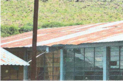
Foto 1: Módulo 3, Sustitución de lámina por lámina troquelada aluzinc calibre 26.