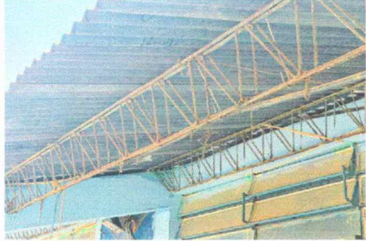
Foto 2: Módulo 4, Mantenimiento a estructura de soporte de metal .