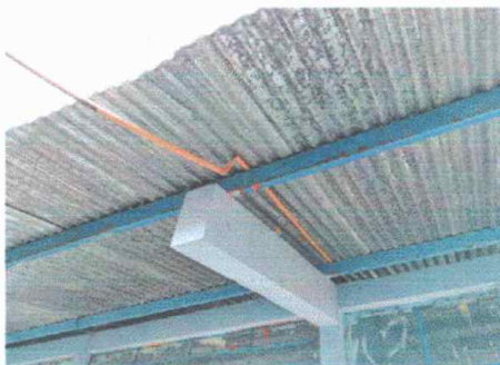
Foto 5: Módulo 3, Mantenimiento a estructura de soporte de metal.