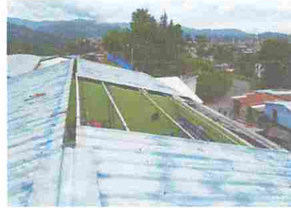
Reparación de canales segundo Nivel