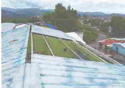
Foto 11. Reparación de canales del segundo nivel de aulas

Observación: Si es necesario se pueden agregar hojas adicionales y actualizar el número de hojas.