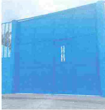
Foto7: Reparación de portón