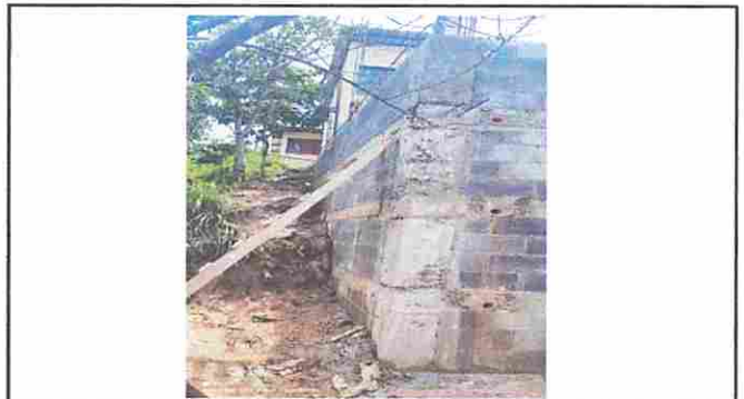
FOTO 4: VISTA LATERAL DE ESPACIO PARA REPARACIÓN DE MURO DE CONTENCIÓN