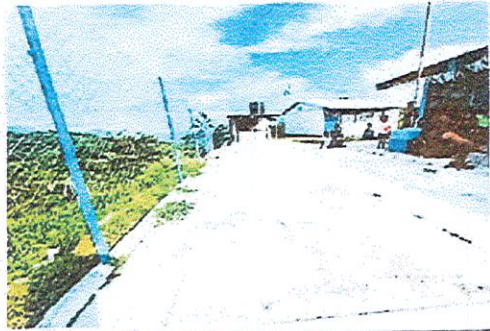
Foto 3: REPARACIÓN DE MURO PERIMETRAL DE BLOCK, CON TUBO HG Y MAYA GALVANIZADA