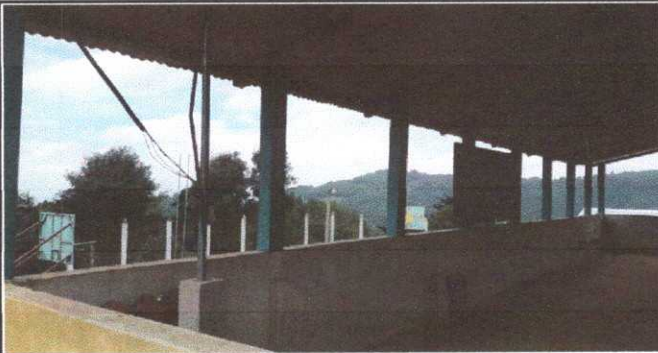
Foto 3. Módulo 1: Suministro e instalación de ventana de PVC y balcón de hierro.