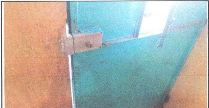
Foto 6. Módulo 1: Sustitución e instalación de chapas de puerta de metal.

Observación: Si es necesario se pueden agregar hojas adicionales y actualizar el número de hojas.