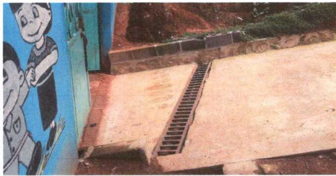
Foto 9. Módulo 2: Sustitución de Tubería PVC de línea principal de aguas pluviales.