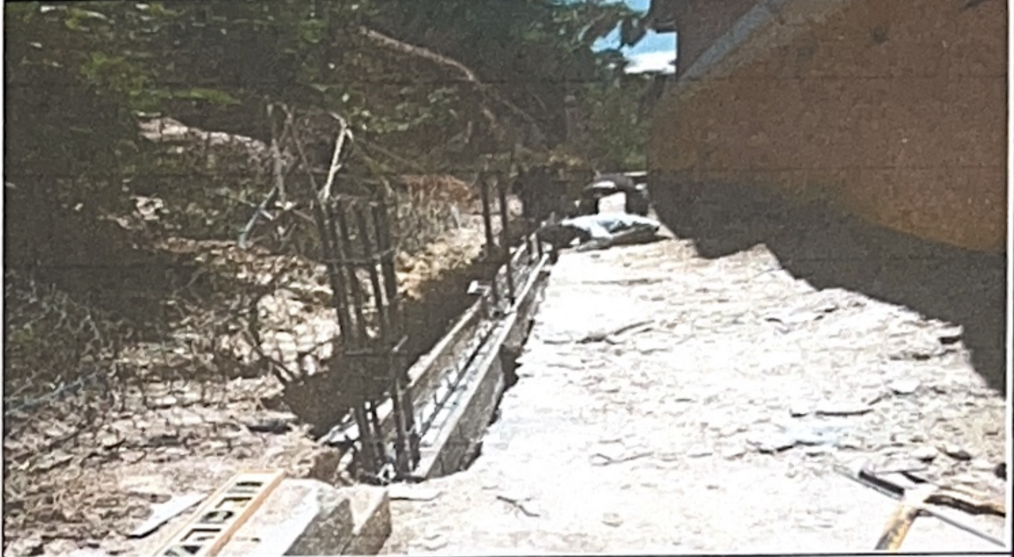
Foto 2: Modulo 1. Reparación de muro perimetral de block con tubo hg y malla galvanizada, soleras intermedias y columnas