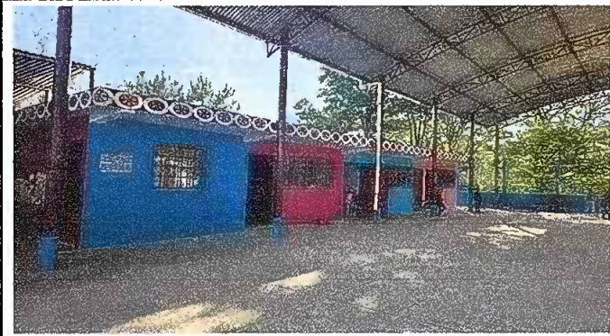
Foto1: aplicación de pintura interios y exterior