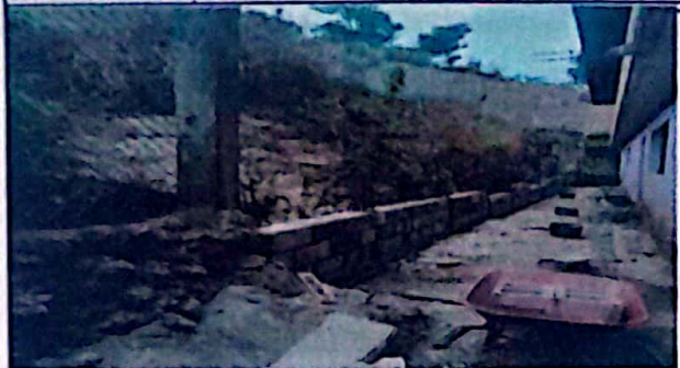
Módulo 1: Reparación de muro perimetral de block con tubo hg y malla galvanizada, soleras intermedias y columnas.