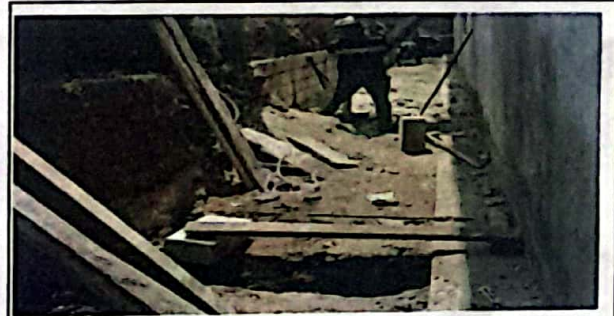
Módulo 2: Sustitución de tubería PVC línea principal aguas fluviales