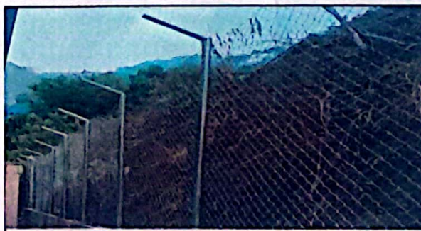
Módulo 1: Reparación de cerco de alambre

Observación: Si es necesario se pueden agregar hojas adicionales y actualizar el número de hojas.