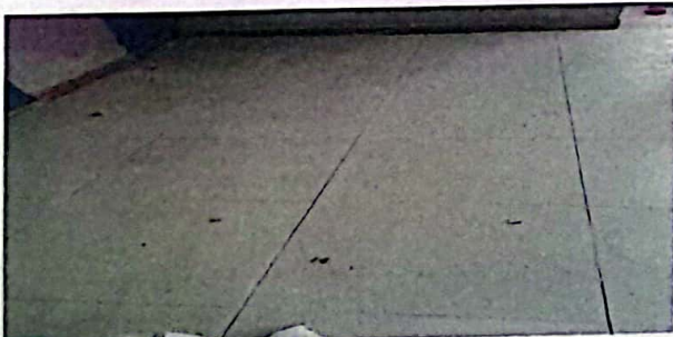
Módulo 4: sustitución de piso cerámico