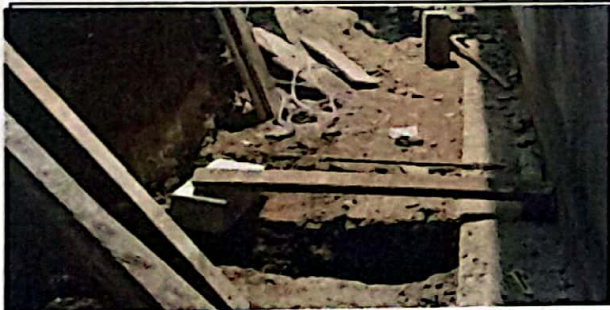
Módulo 2: Instalación de tubería principal de pvc