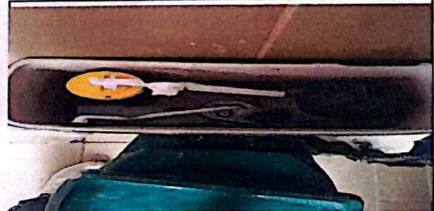
Módulo 4: Sustitución de accesorios inodoro (contra llave, tubo de abasto y tanque)

Observación: Si es necesario se pueden agregar hojas adicionales y actualizar el número de hojas.