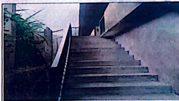
Módulo 1: Fabricación e instalación de baranda de metal para gradas.