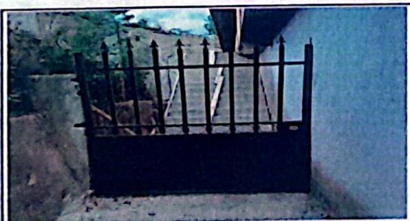
Módulo 1: Fabricación e instalación de puerta de rejas