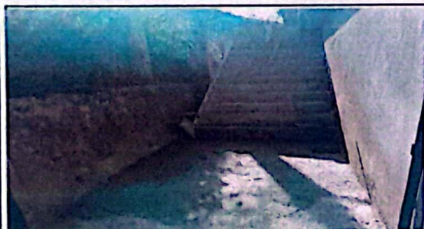
Módulo 1: Sustitución de gradas de concreto