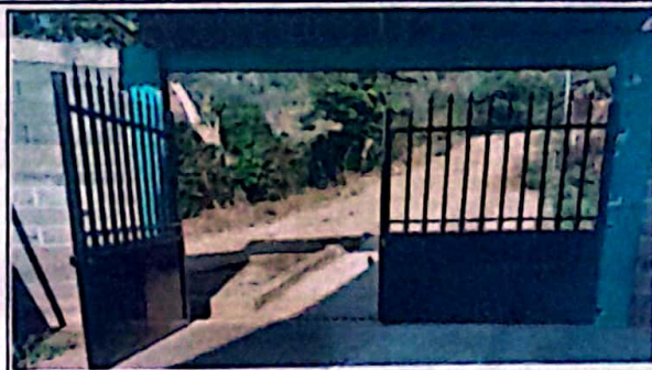
Módulo 1: Fabricación e instalación de portón de metal de ingreso