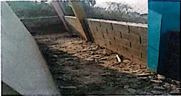
Módulo 2: Reparación de planchas de concreto de patio