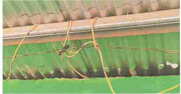
Foto 2: Módulo 2, Desinstalación de cableado eléctrico, ducto + accesorios.