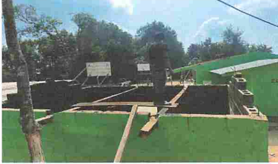
Foto 1: Módulo 2. Desinstalación de lámina y estructura portante existente.