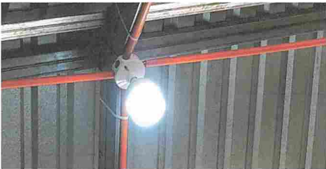
Foto 5: Módulo 2. Instalación de cableado eléctrico y ducto + accesorios.